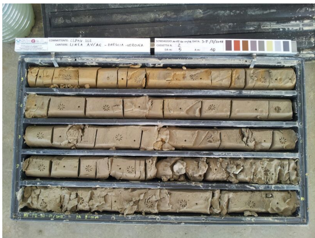
SONDAGGIO AV-PE-SO-01/18 – Cassa n.2 da 5.00 m a 10.00 m