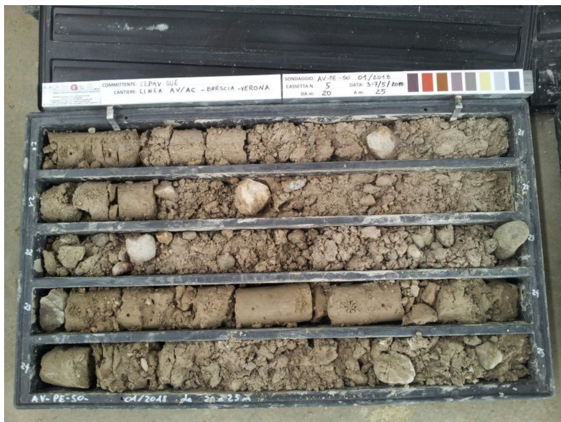
SONDAGGIO AV-PE-SO-01/18 – Cassa n.5 da 20.00 m a 25.00 m