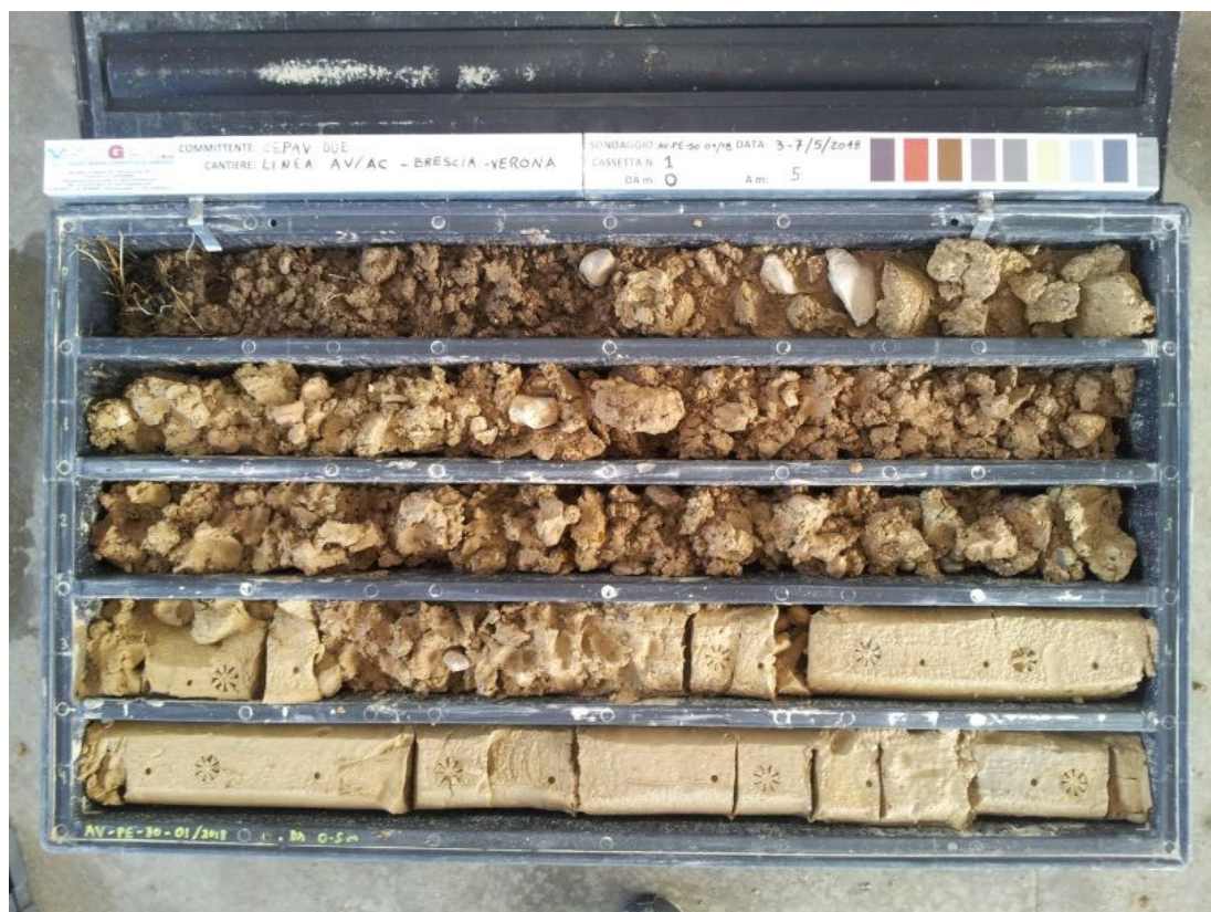
SONDAGGIO AV-PE-SO-01/18 – Cassa n.1 da 0.00 m a 5.00 m