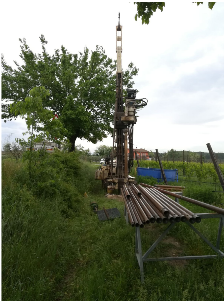
SONDAGGIO AV-PE-SO-01/18 – Postazione