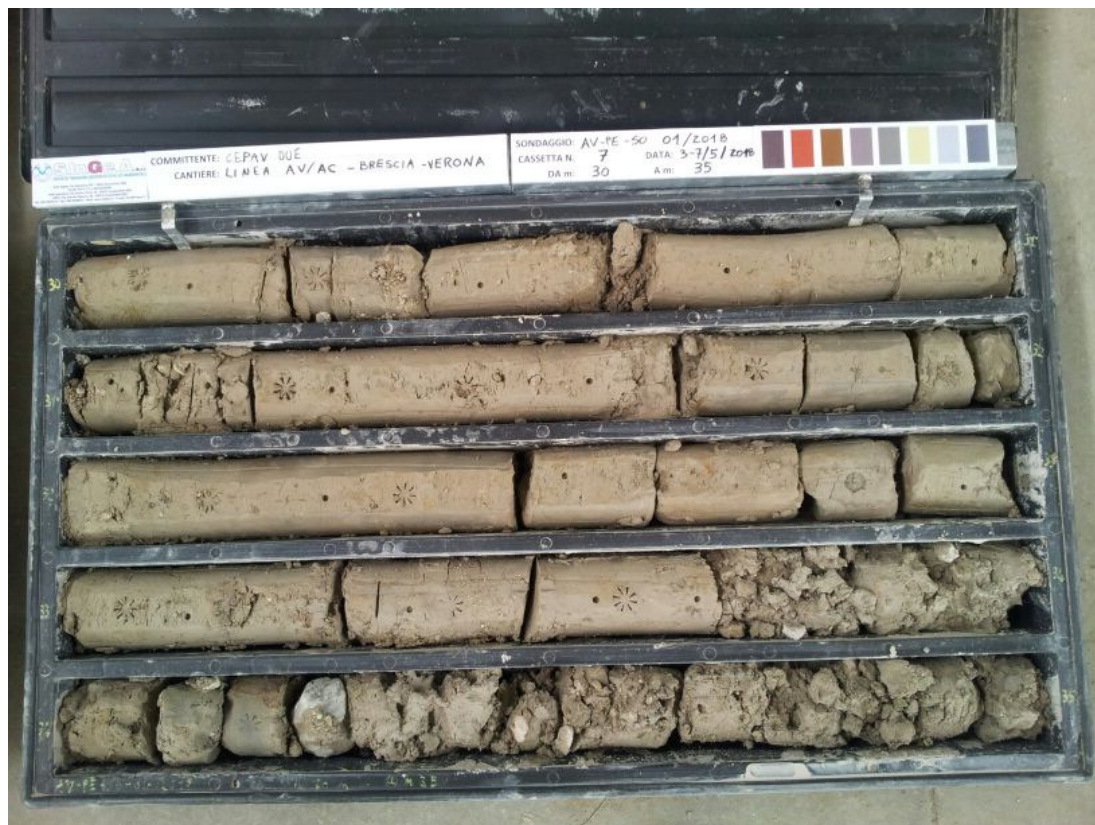
SONDAGGIO AV-PE-SO-01/18 – Cassa n.7 da 30.00 m a 35.00 m