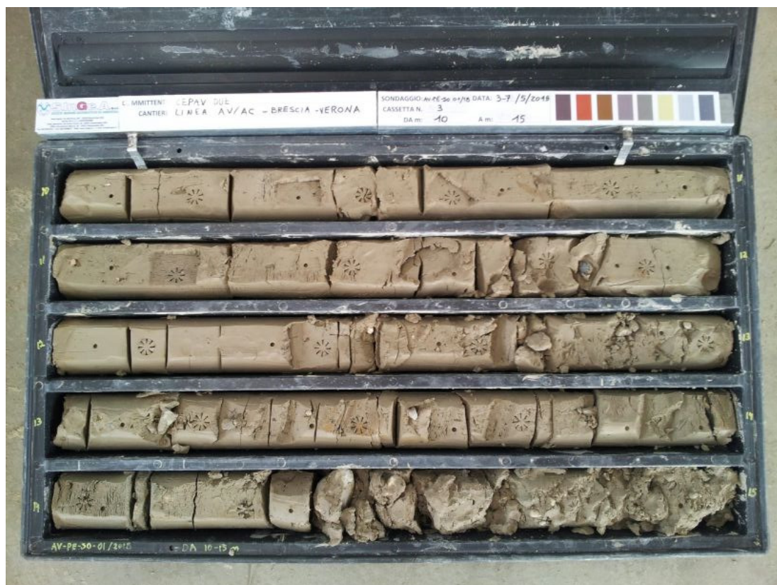
SONDAGGIO AV-PE-SO-01/18 – Cassa n.3 da 10.00 m a 15.00 m